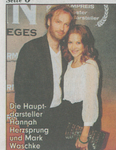
Die Hauptdarsteller Hannah Herzsprung und Mark Waschke